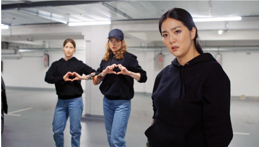
DEFENDER, 2021, Videostill