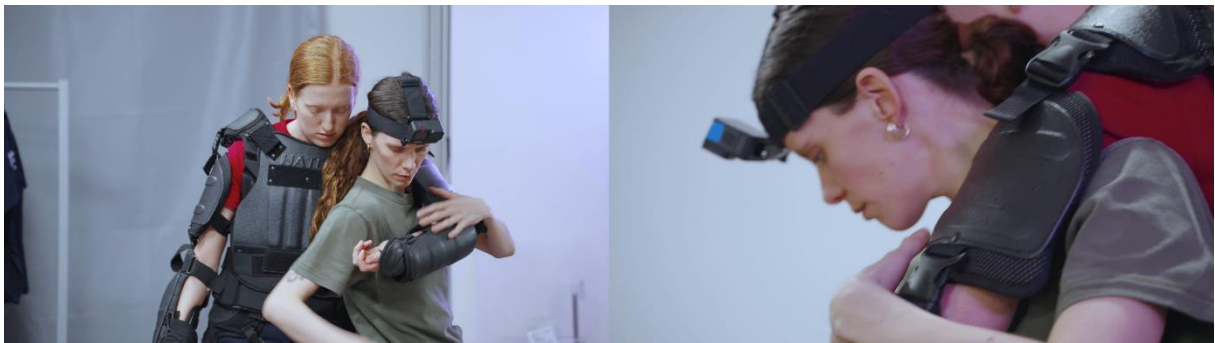
© Stefan Panhans/Andrea Winkler, Border Control , 2021, Videostill