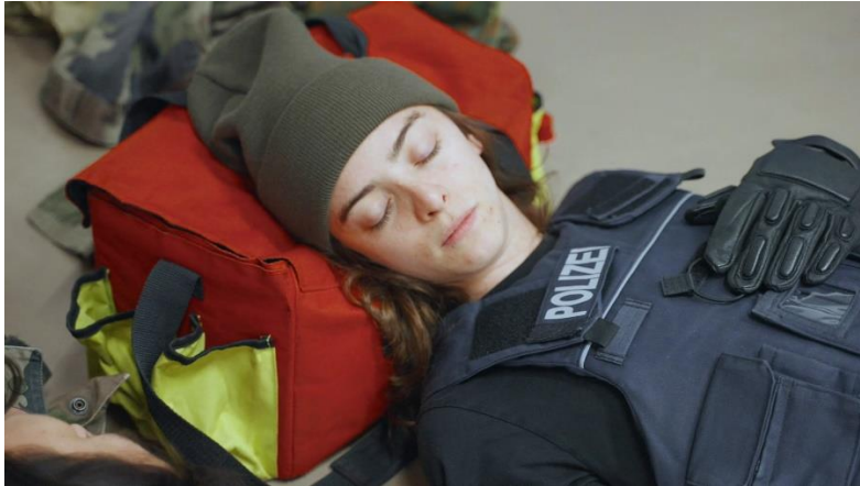
© Stefan Panhans/Andrea Winkler, Border Control , 2021, Videostill (Detail)